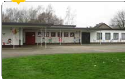
Vrije basisschool - St Albertus wijkkleuterschool de Ballon Gouverneur Alex Galopinlaan 13 089 38 09 38