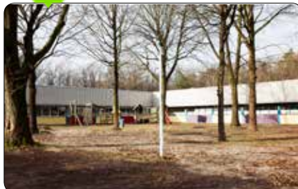
Vrije Basisschool Lucerna Woudstraat 25 089 74 19 15